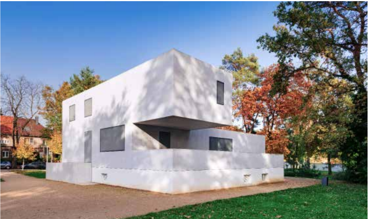
↑ Walter Gropius, Master House Dessau-Roßlau, Germania