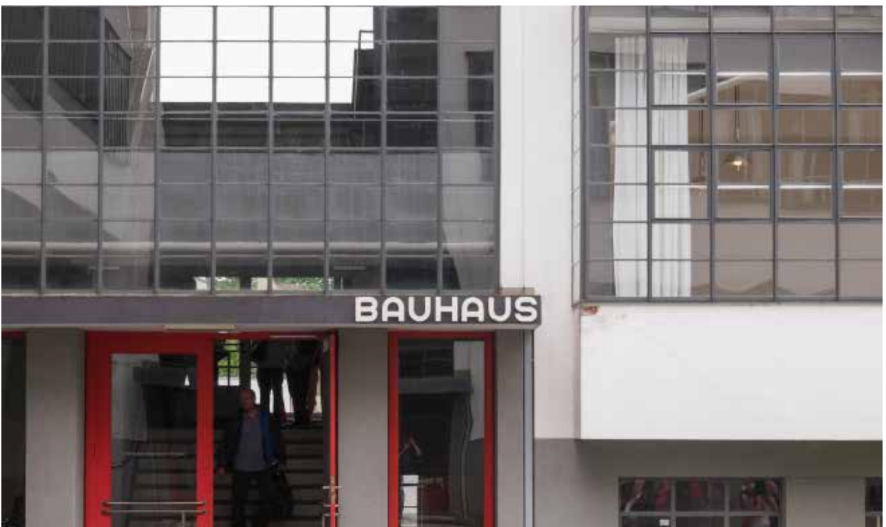
↓ Bauhaus Archive Dessau-Roßlau, Germania Micheal Jacobs, iStock by Getty Images