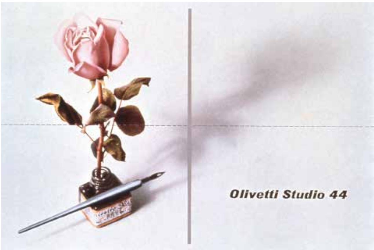
↑ Olivetti Studio 44, manifesto pubblicitario (L. Sinisgalli, C. Nivola e G. Pintori, 1952). Tratto da un'idea del 1938 degli stessi autori per la Studio 42. Associazione Archivio Storico Olivetti, Ivrea

impegnativi e per sostituirmi alle funzioni precedenti suggerii Pintori, che venne assunto come impiegato. Alla Olivetti con Fancello, Pintori, Guizzi, Algarotti e altri, abbiamo contribuito alla formazione dello studio grafico, soprattutto con le nostre potenzialità intuitive. Anche se nessuno ci aveva spiegato in che modo i principi del disegno sono gli stessi applicabili al disegno del grattacielo, del cucchiaino o della pagina pubblicitaria, noi vi abbiamo creduto”. 5